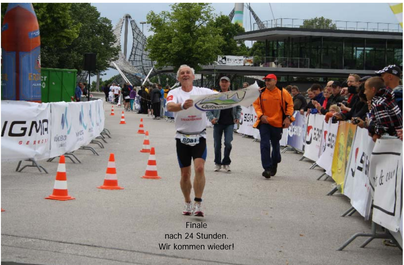
Finale nach 24 Stunden. Wir kommen wieder!

Der Veranstalter hätte gut getan, alle Finisher auf der Bühne zu präsentieren. Sie hätten es wahrlich verdient.